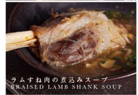
ラムすね肉の煮込みスープ BRAISED LAMB SHANK SOUP