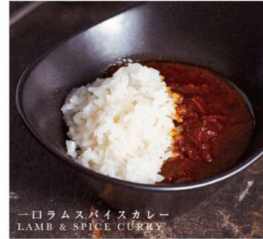
一口ラムスパイスカレー LAMB & SPICE CURRY