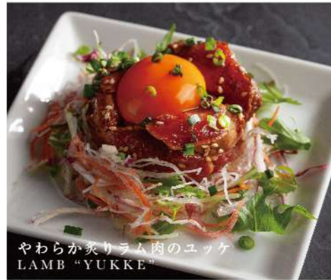
やわらか炙りラム肉のユッケ LAMB "YUKKE"

やわらか炙りラム肉のユッケ ~卵黄添え~ ¥1,280 驚くほど柔らかな新鮮なラム肉を是非この機会に