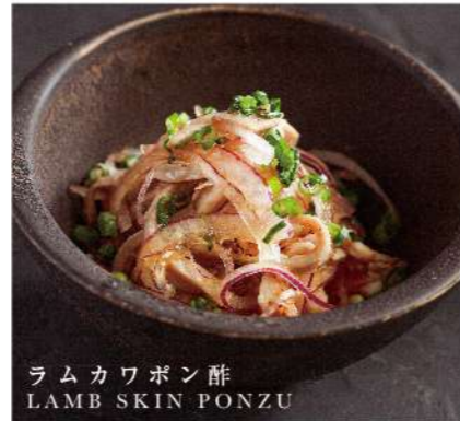
ラムカワポン酢 LAMB SKIN PONZU