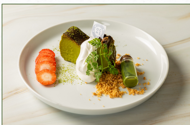
抹茶バスクチーズケーキ Matcha Basque cheesecake