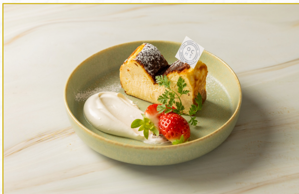
バスクチーズケーキ Basque cheesecake